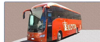
Bilotta Autoservizi via E. totì N°22 88046 Lamezia Terme CZ

Si ricorda: quota rinnovo o nuova iscrizione al Gruppo Micologico Reventino Platania, €30,00